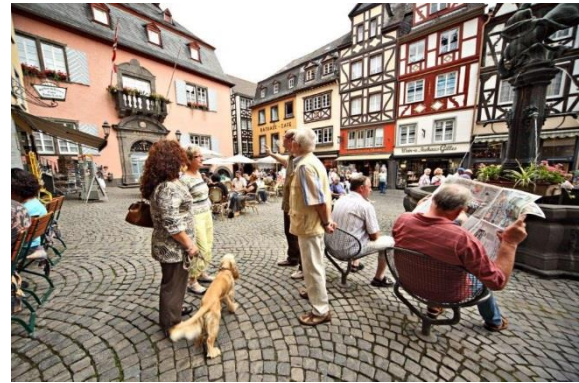
Marktplatz Cochem

Sicherlich empfanden schon die Römer, dass es sich hier gut leben lässt. Ein enges Tal mit steilen Weinbergen, einem Flusslauf, der nach jeder Biegung eine neue Überraschung bereithält und mit Menschen, so liebenswert und humorvoll .... Lassen Sie sich einfangen vom Charme dieser malerischen und geschichtsträchtigen Landschaft